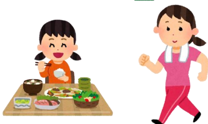
インフルエンザ出席停止期間早見表