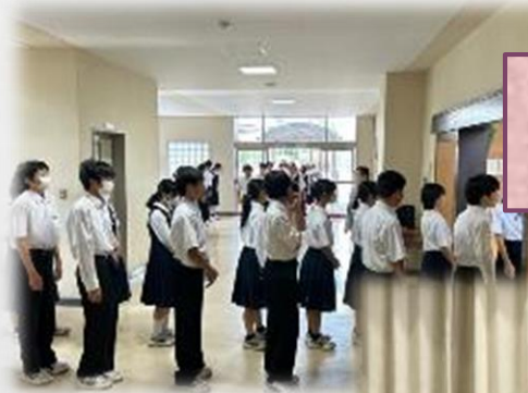
無言集合 無言整列