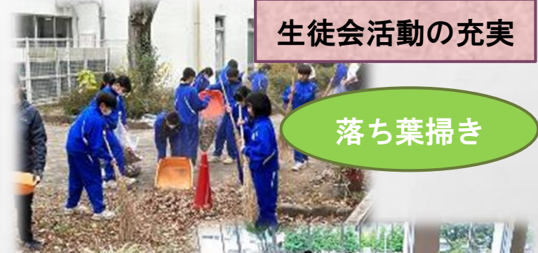
生徒会活動の充実