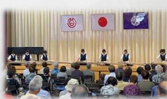
敬老会での 「箏曲部演奏」