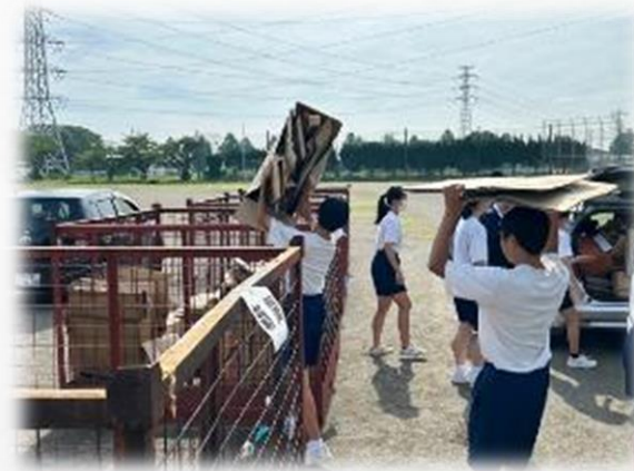
小学校の先生も参加 「資源回収」