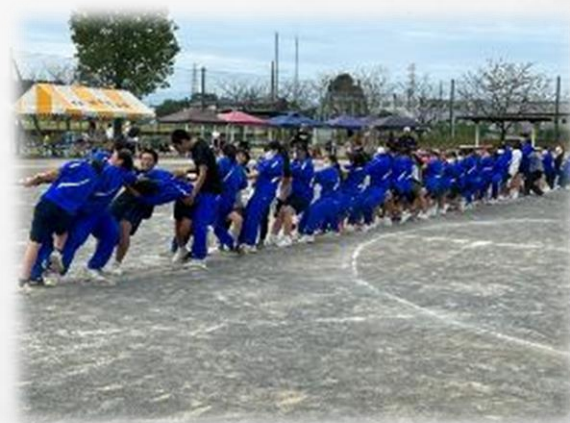
生徒は選手兼役員 「地区運動会」