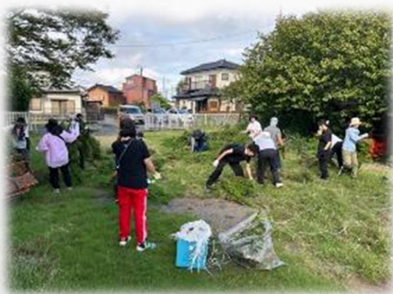
地域の企業も参加 「奉仕作業」