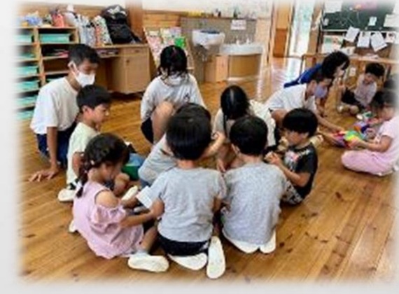
幼稚園での 「幼児ふれあい体験」