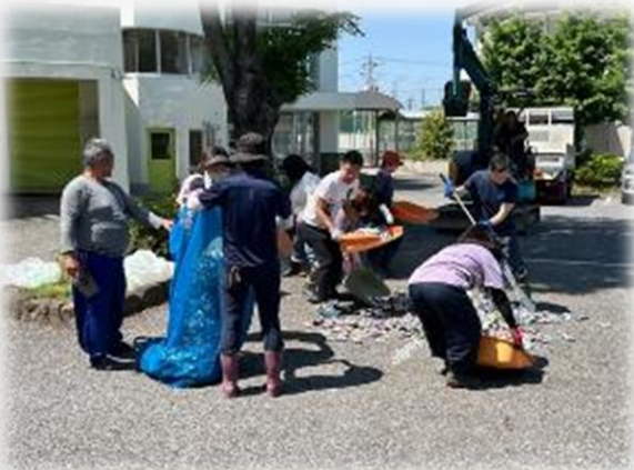
おやじの会主催 「アルミ缶回収」