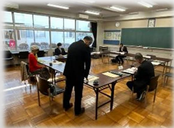
小中合同学校運営協議会