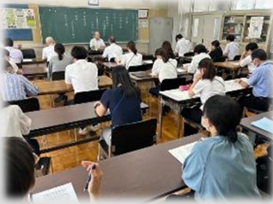
小中合同教職員研修会